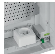
integrována zásuvka 230V